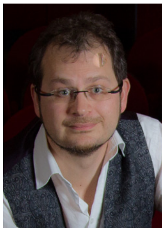
PIANIST ERWIN DELEUX